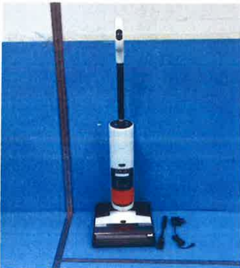
Imagem a cores do produto: