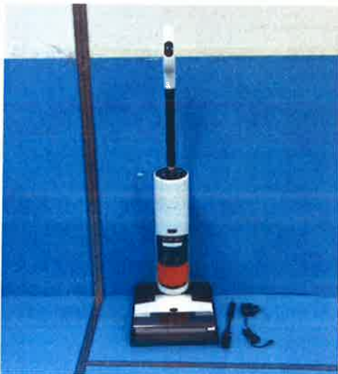
Immagine a colori del prodotto: