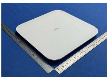
Imagem a cores do produto: