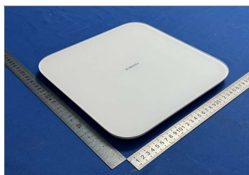
Imagen en color del producto: