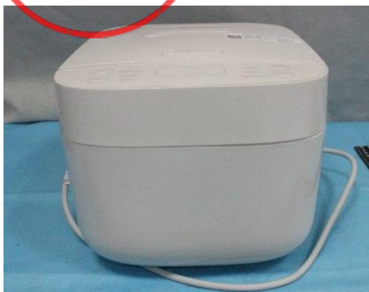
Immagine a colori del prodotto: