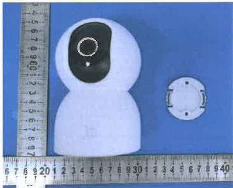
Color Image of product