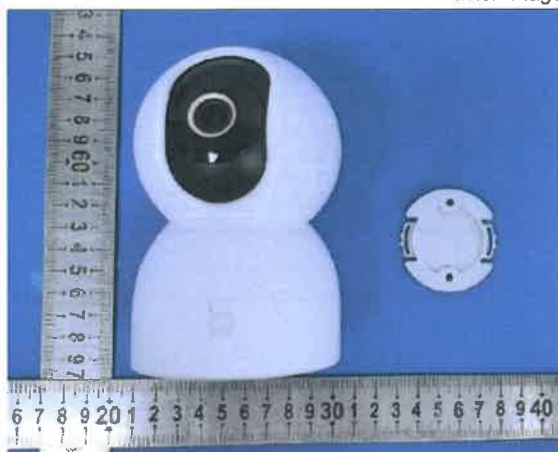
Color Image of product