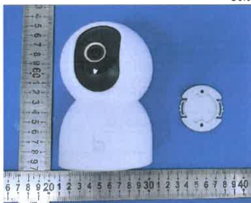
Color Image of product