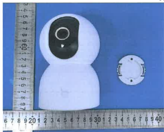
Color Image of product