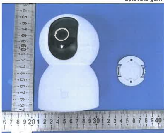
Splavota gaminio nuotrauka