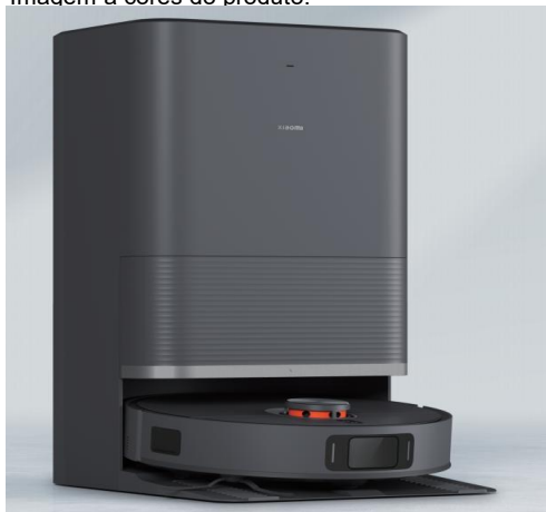
Imagem a cores do produto: