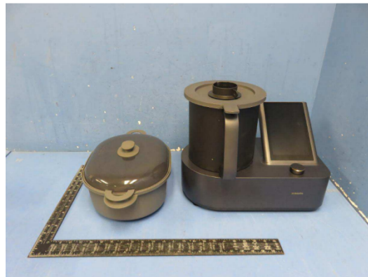
Imagem a cores do produto: