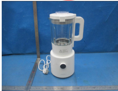
Imagen en color del producto: