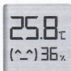
Immagine a colori del prodotto: